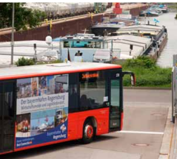
Der Bus kommt. Und was für einer! bayernhafen unterwegs in Regensburg

Noch mehr Container-Kapazitäten im bayernhafen Bamberg: Nach Hanjin und MOL disponiert auch Hapag Lloyd, eine der größten Container-Reedereien der Welt, ihre Leercontainer im bayernhafen Depot. Leercontainer können jetzt noch flexibler geordert und wieder zurückgegeben werden; das bringt kürzere Vor- und Nachläufe für die verladende Wirtschaft. TFG Transfracht, durch die der neue Depotkunde gewonnen wurde, verbindet mit dem Zugsystem AlbatrosExpress den Terminal Bamberg mit den deutschen Seehäfen Bremerhaven und Hamburg.