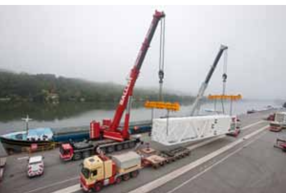
Gute Reise nach Indien! LINDE Schwergewichte wechseln in Passau-Schalding aufs Schiff.

Um den Betrieb der Anlegestelle, die in unmittelbarer Nachbarschaft zum bayernhafen Nürnberg liegt, bewirbt sich die Hafen Nürnberg-Roth GmbH. Dadurch könnten die Erfahrungen der bayernhafen Gruppe aus anderen Standorten genutzt und Synergien für Reedereien gehoben werden.