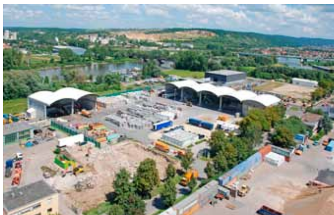
bayernhafen Regensburg - bis Mitte der neunziger Jahre wurden hier (linkes Bild), auf dem Gelände der Hitzler-Werft an der Budapester Straße, Schiffe gebaut. Ende 2005 erwarb bayernhafen das Gelände, baute die Werftanlagen zurück, legte eine neue Straße an und schuf damit die Voraussetzung für die Nachnutzung. Eine davon ist ZellnerRecycling (rechtes Bild), einer der modernsten Entsorgungsfachbetriebe Bayerns im Bereich Altpapierverwertung, Kunststoff-Recycling, Elektroschrott-Entsorgung, Akten- und Datenvernichtung. Zellner war bereits 1982 an anderer Stelle im Hafen als reiner Altpapiersortierbetrieb gestartet und suchte dann Erweiterungsfläche. Noch in diesem Jahr soll ein neues Bürogebäude hinzukommen. Eine zweite Neuansiedlung gleich nebenan (im Hintergrund sichtbar) ist die RVR Rohstoffverwertung, die jetzt am Westhafen Straße, Bahn und Schiff für den Transport von Schrott und Metall nutzt. So investiert bayernhafen immer wieder in die Zukunft seiner Standorte - zum Nutzen von Ansiedlern, deren Mitarbeitern und Kunden.